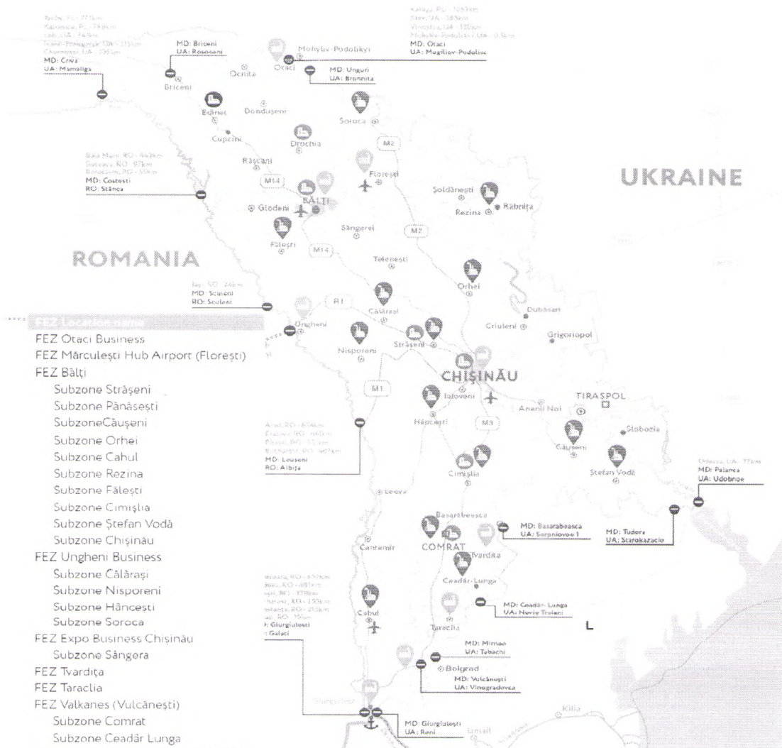
Main distances in km and hours (h)